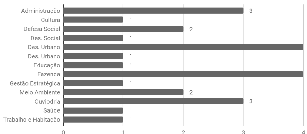
Gráfico 2 - Total de Pedidos de Acesso à Informação por Secretaria