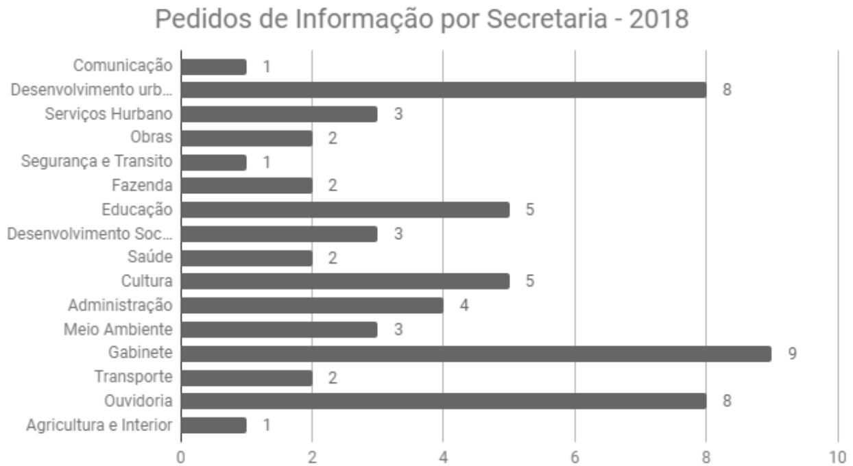
Gráfico 2 - Total de Pedidos de Acesso à Informação por Secretaria

Os pedidos de acesso à informação são direcionados às secretarias, para que a resposta seja providenciada. O Gráfico 2 apresenta o quantitativo de solicitações por secretaria.